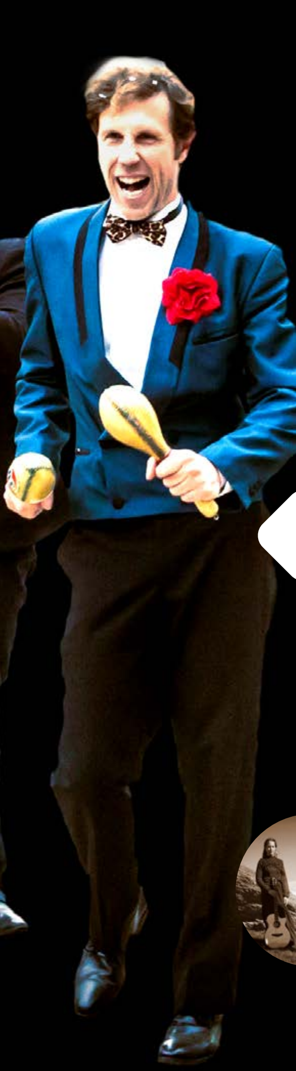
© AB Picaflores, SOUNDESOUJLS, Jurassic Grass